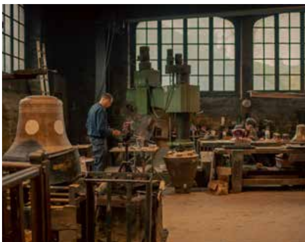
Vues de l'atelier, Fonderie Cornille-Havard, Villedieu-les-Poêles, 2023, ©Tomasz Namerla.

Entre le XIX e et le début du XX e siècle, le nombre de fondeurs a fortement diminué passant de 86 à 35. Aujourd'hui, deux grands fondeurs sont encore en activité : l'entreprise Paccard en Haute-Savoie et la fonderie Cornille-Havard en Normandie.