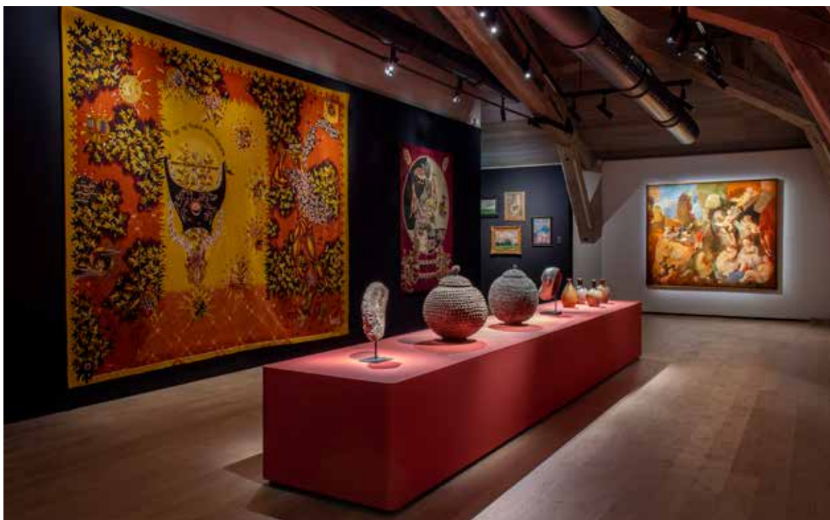
© Adagp, Paris - Crédit photographique : Marc Damage

La politique d'expositions, étant elle aussi fondée sur un principe de dialogues, le musée organise, l'été, une grande exposition en partenariat avec des institutions reconnues pour présenter des figures majeures de l'art moderne. Après le succès de sa première exposition estivale Métamorphoses. Dans l'art de Claude Monet qui a accueilli plus de 85 000 visiteurs à l'été 2022 et Rembrandt en eau forte, en 2023, qui a accueilli 35 000 visiteurs, le musée d'Art moderne de Fontevraud poursuit sa présentation d'artistes majeurs de l'histoire de l'art avec, cette année, une exposition consacrée à Bernard Buffet, qui se tiendra du 8 juin au 29 septembre 2024.