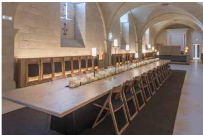
Le petit réfectoire, © Nicolas Matheus.