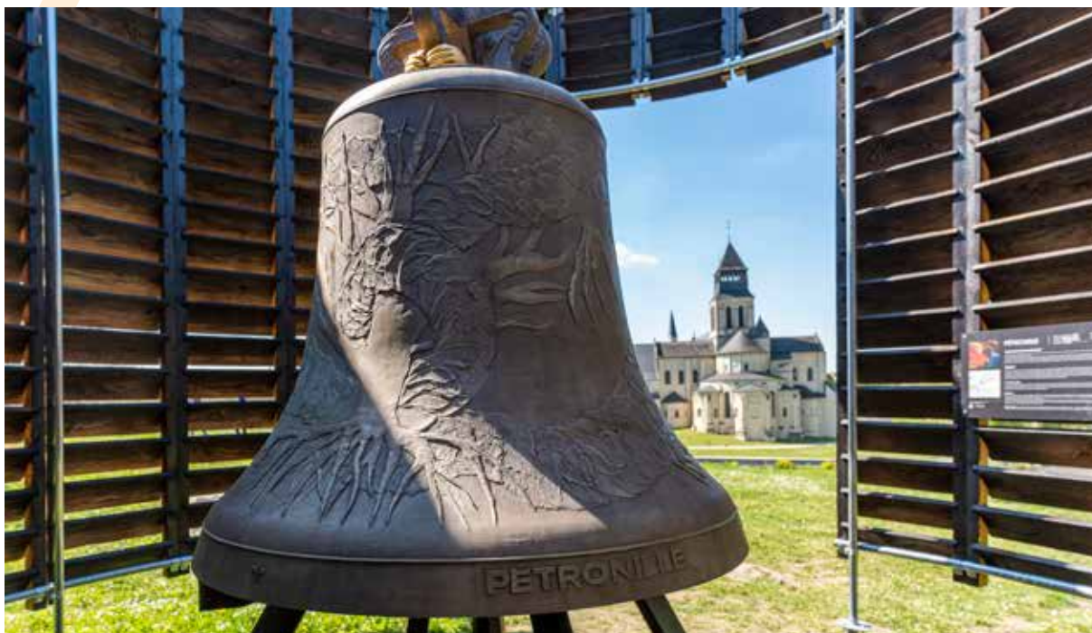
2022, Pétronille, 3 e cloche du projet « À toute volée - six nouvelles cloches pour Fontevraud », ©Victorien-Ameline.