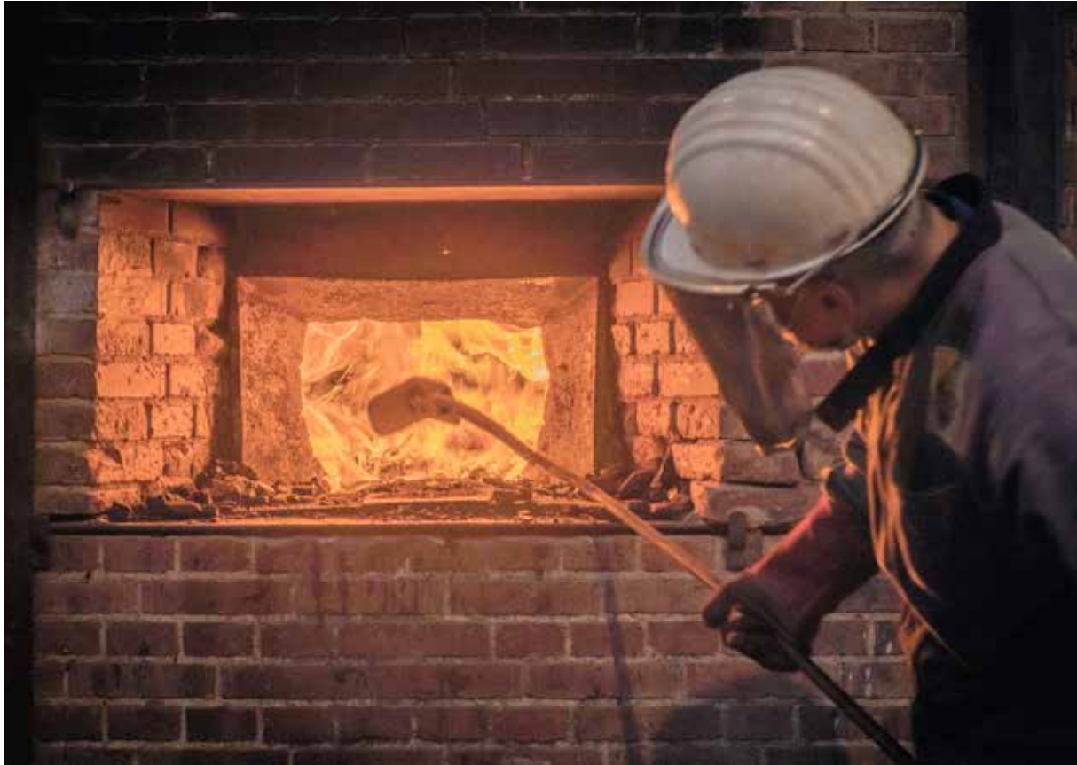
Coulée de la cloche, Fonderie Cornille-Havard, Villedieu-les-Poêles, 2021, ©Tomasz Namerla.

Entre le XIX e et le début du XX e siècle, le nombre de fondeurs a fortement diminué passant de 86 à 35. Aujourd'hui, deux grands fondeurs sont encore en activité : l'entreprise Paccard en Haute-Savoie et la fonderie Cornille-Havard en Normandie.