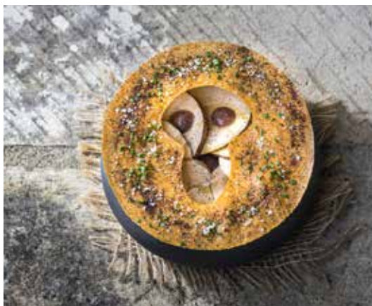
Champignon de Paris, à Fontevraud, © Anjou Tourisme / Christophe Martin.