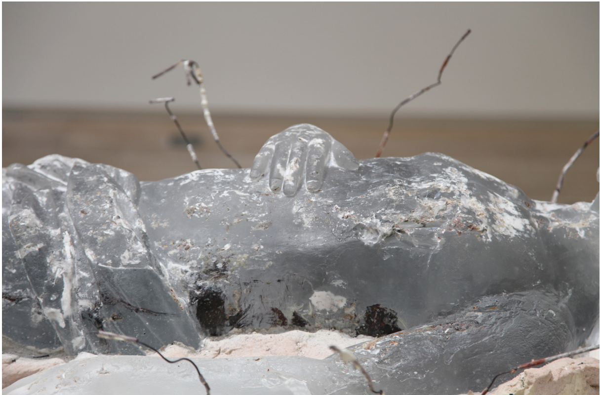
Cristallisation II , 2013 (détail) Cristallisation au bois perdu Verre optique, plâtre, métal, charbon de bois, 140 x 50 x 30 cm Maître verrier Olivier Juteau Collection privée