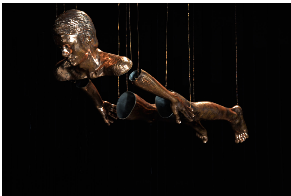
Portrait de jeune homme en martyr #1, 2016 Empreinte de corps Argent sur cuivre, 175 x 55 x 29 cm Collection de l'artiste

A ssociant l'idée de la décapitation liée à saint Denis et l'iconographie de saint Barthélémy, le Portrait de jeune homme en martyr a pour modèle mon fils de dix-huit ans. Un traitement complexe d'électrolyse de cuivre sur cire à partir d'empreintes de son corps a réussi à créer un relief sur la peau laissant apparaître des veines. A l'intérieur les membres sont vides, et le cuivre lisse est recouvert d'argent. Jambes, bras et tête sont disposés dans l'espace comme s'ils résultaient d'un écartèlement. Comme dans le cas des conversions de matières, du bois au verre par exemple, la quête des processus sculpturaux passe par des opérations rigoureuses mais aussi par une très grande attention aux accidents.