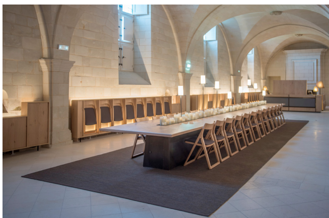
Le petit réfectoire, © Nicolas Matheus.