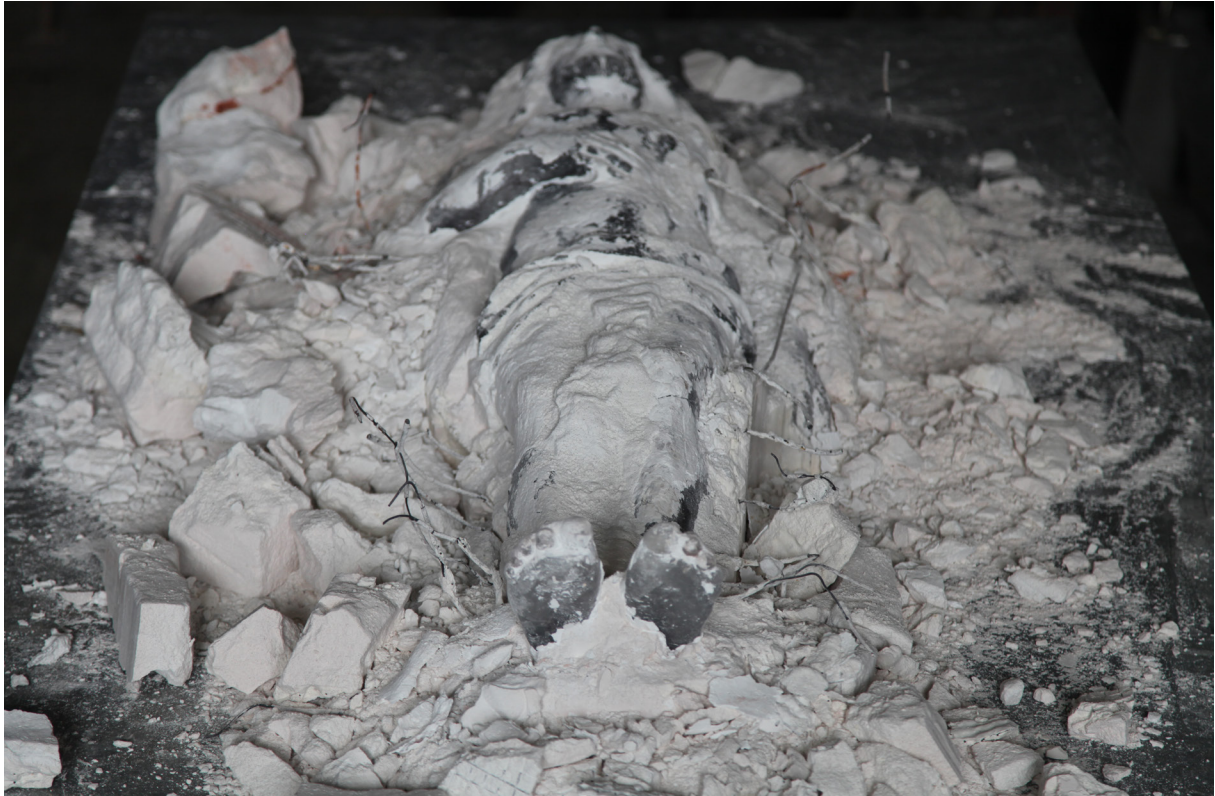
Cristallisation II , 2013 (détail) Cristallisation au bois perdu Verre optique, plâtre, métal, charbon de bois, 140 x 50 x 30 cm Maître verrier Olivier Juteau Collection privée