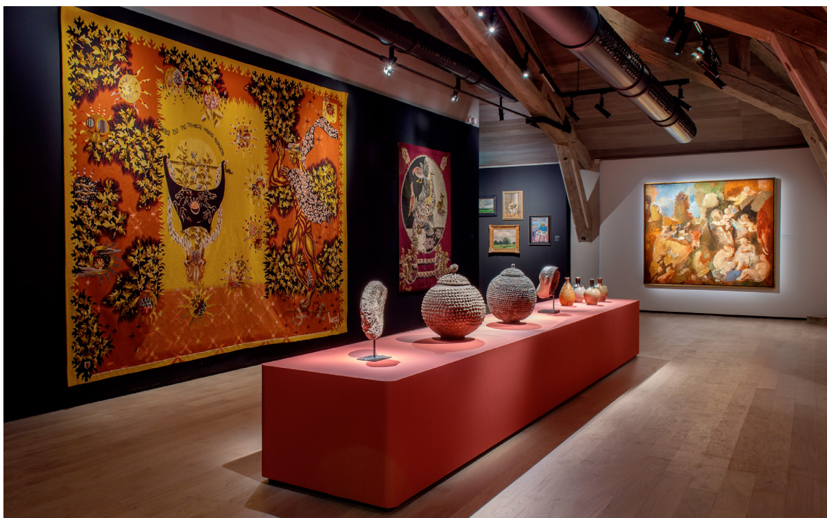
© Adagp, Paris - Crédit photographique : Marc Domage

La politique d'expositions, étant elle aussi fondée sur un principe de dialogues, le musée organise, l'été, une grande exposition en partenariat avec des institutions reconnues pour présenter des figures majeures de l'art moderne. Après le succès de sa première exposition estivale Métamorphoses. Dans l'art de Claude Monet qui a accueilli plus de 85 000 visiteurs à l'été 2022 et Rembrandt en eau forte, en 2023, qui a accueilli 35 000 visiteurs, le musée d'Art moderne de Fontevraud poursuit sa présentation d'artistes majeurs de l'histoire de l'art avec, cette année, une exposition consacrée à Bernard Buffet, qui se tiendra du 8 juin au 29 septembre 2024.