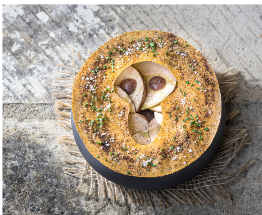
Champignon de Paris, à Fontevraud, © Anjou Tourisme / Christophe Martin.